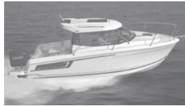
Merry Fisher 695