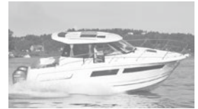
Merry Fisher 855