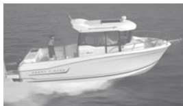
Merry Fisher 695 marlin