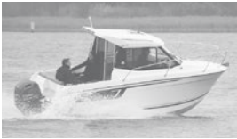
Merry Fisher 605